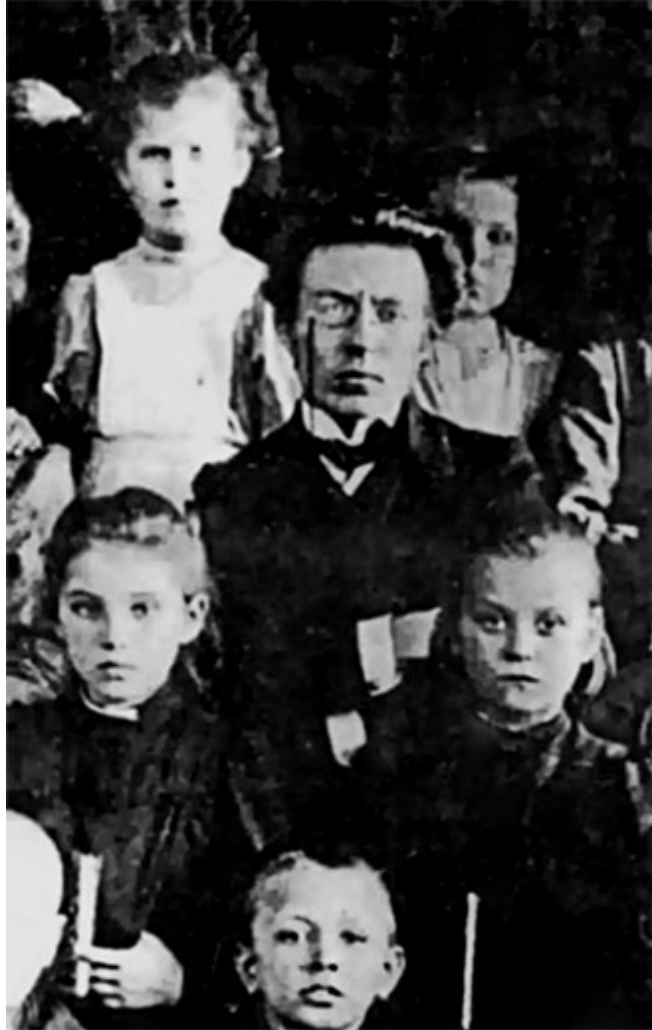
5. А. С. Макаренко с учениками. Крюков. 1905–1906 гг.