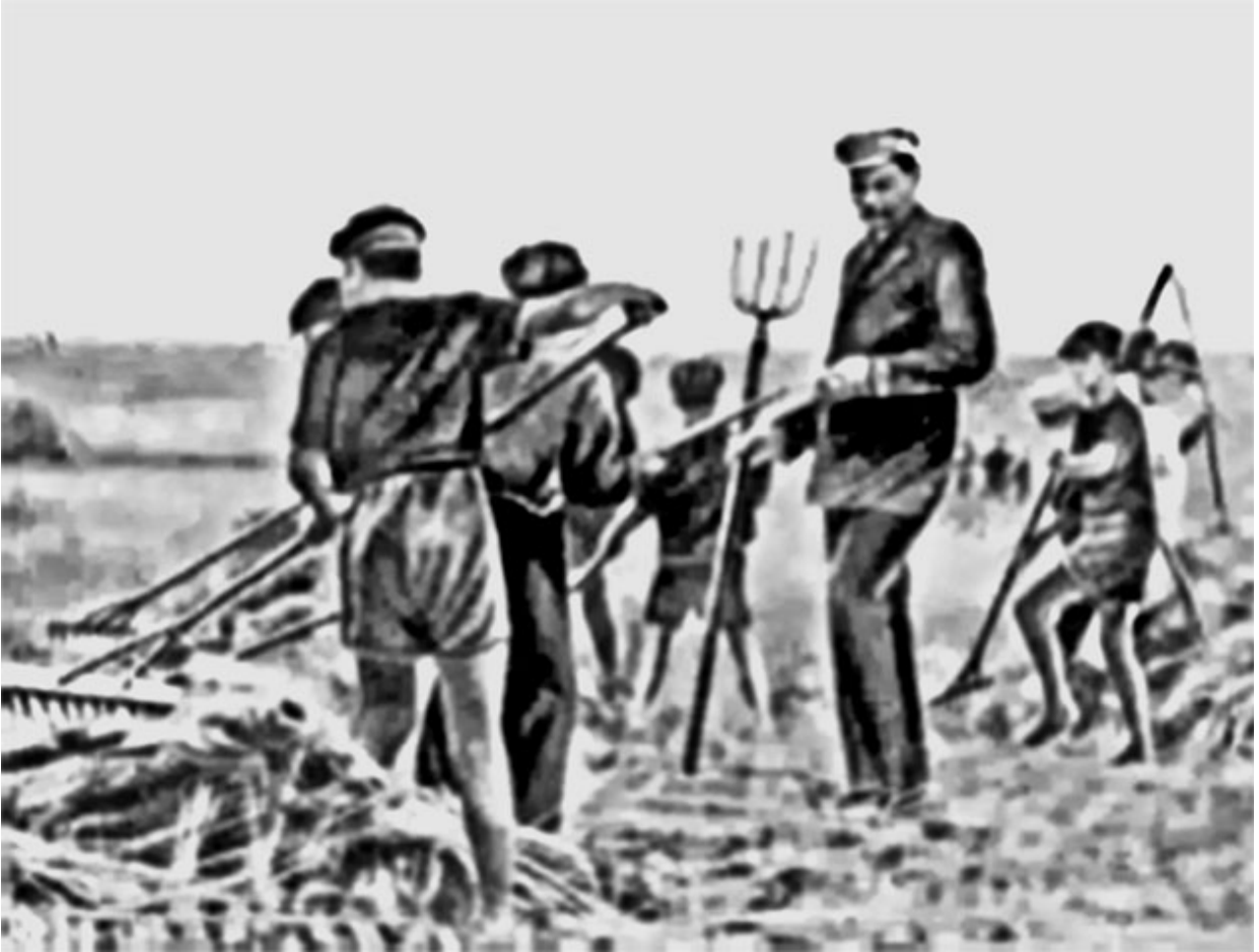
50. А. М. Горький с колонистами на работе.