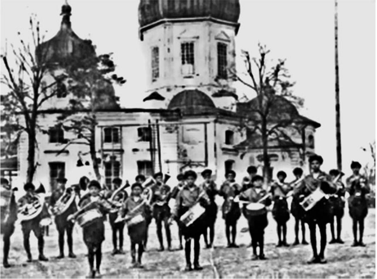
51. Первые музыканты колонии им. М. Горького. Куряж, 1927 г.