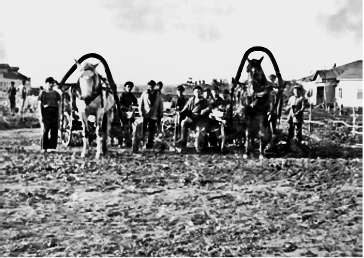
28. Вид на Главный дом 2-й колонии им. М. Горького в Трепке (с. Ковалевка).