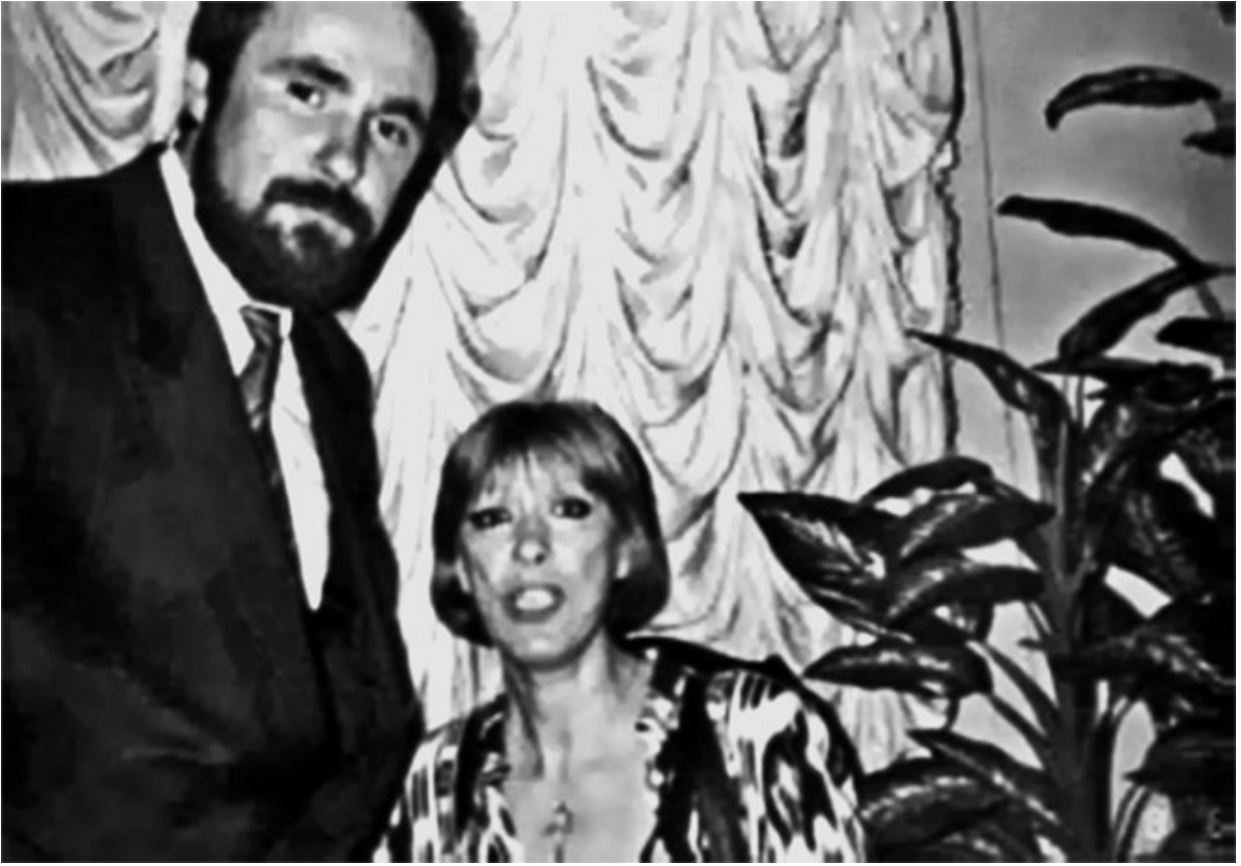
71. Брат и сестра Васильевы – внучатые племянники А. С. Макаренко.