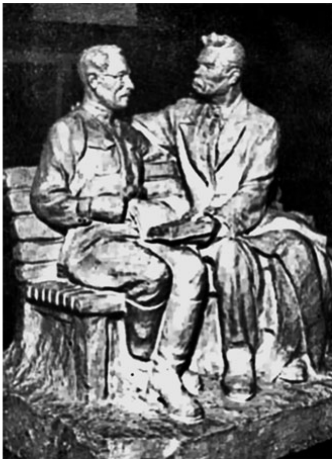
79. Горький и Макаренко. Скульптура К. Пospelова.