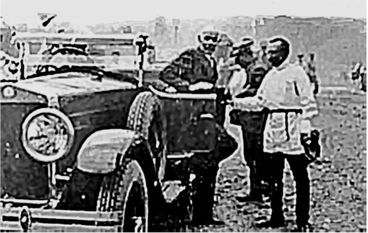
49. Встреча М. Горького – шефа колонии – с А. С. Макаренко и горьковцами (8 июля 1928 г.).