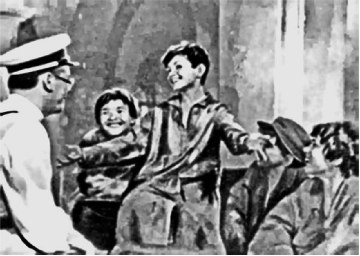
52. Кадры из художественного фильма «Педагогическая поэма».