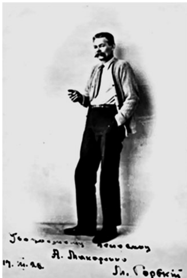
48. Фотография А. М. Горького с дарственной подписью.