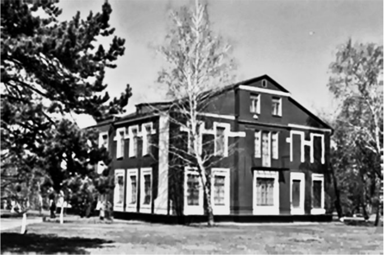
31. Флигель колонии им. М. Горького.