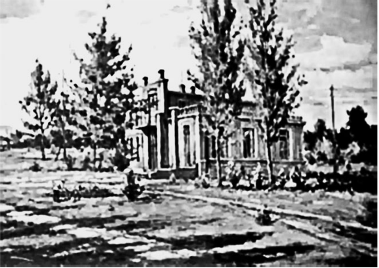
30. Главное здание колонии («В» – «Красный дом») в усадьбе, где размещались зал, столовая, классы, мастерские, кабинет. В настоящее время – Музей-заповедник А. С. Макаренко.