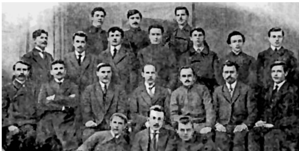
14. А. С. Макаренко. 1917–1918 гг.