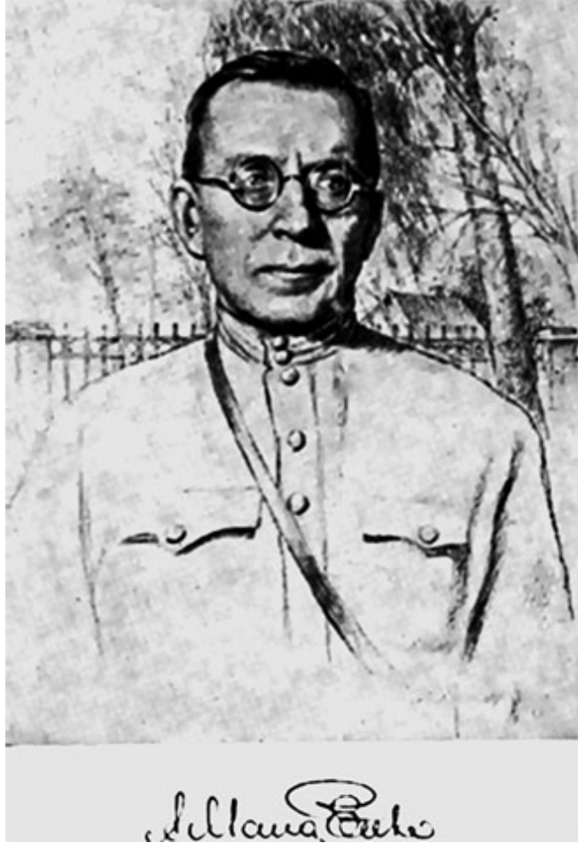
80. Портрет А. С. Макаренко работы художника А. Яр. Кравченко.