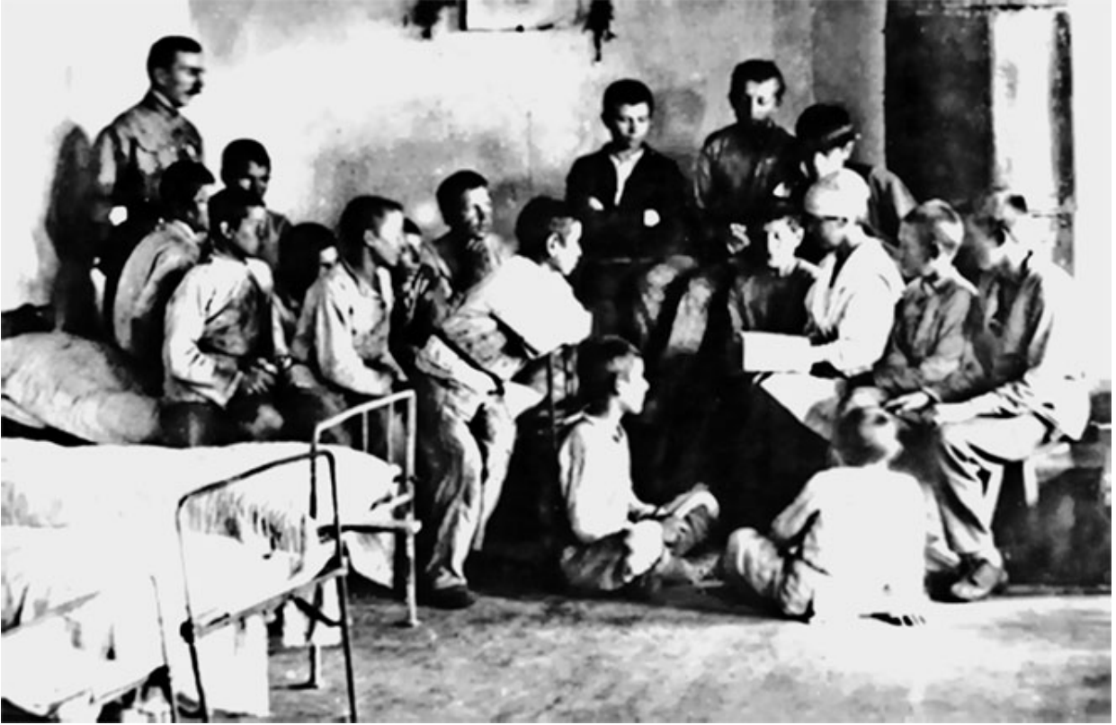
21. А. С. Макаренко. 1923 г.