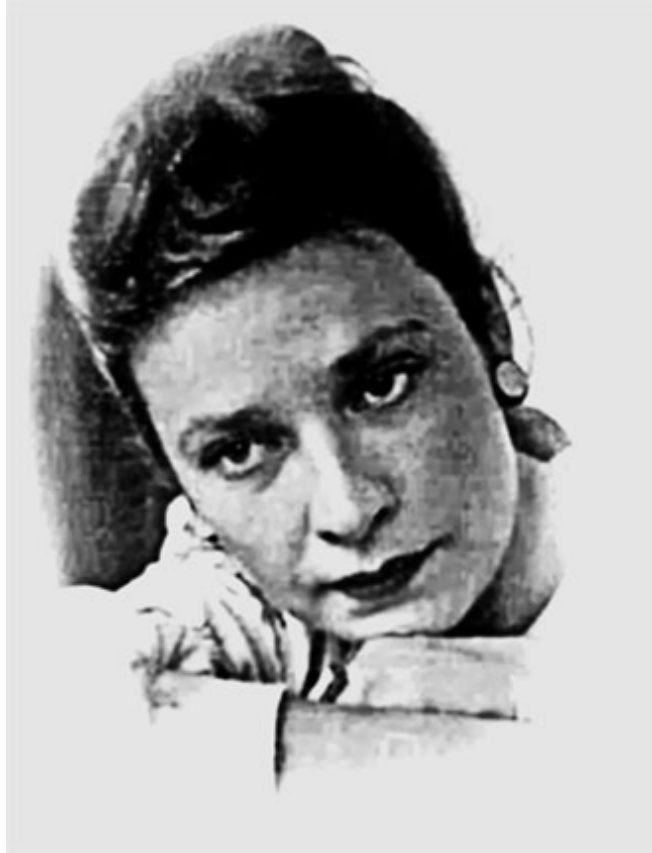
69. О. В. Макаренко. 1946 г.