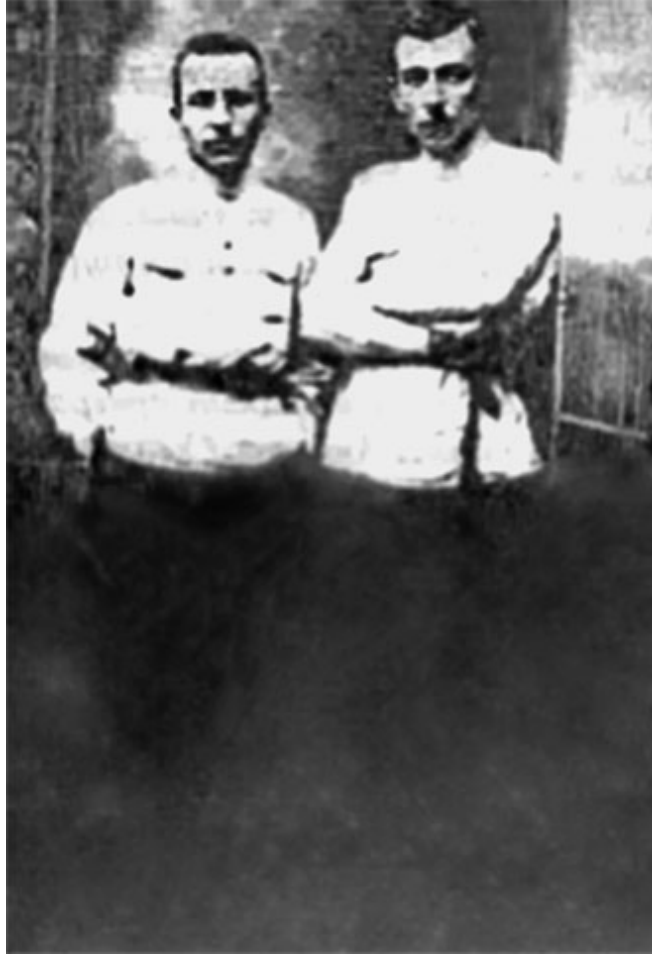
18. А. С. Макаренко – заведующий колонией имени М. Горького. 1920 г.