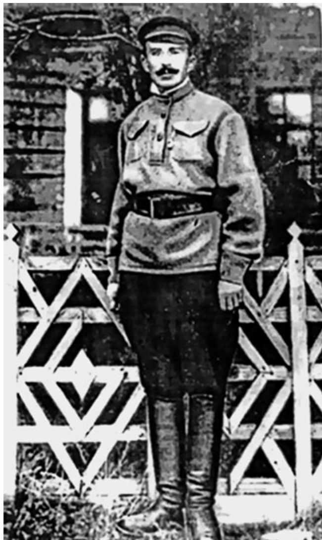
20. Чтение книги в спальне колонистов. Слева стоит А. С. Макаренко. 1921 г.