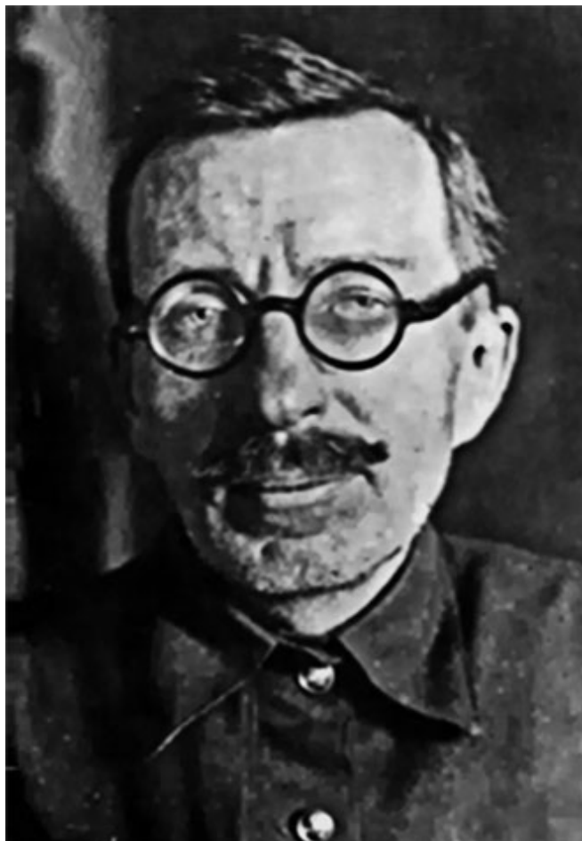
68. А. С. Макаренко. 1932 г.