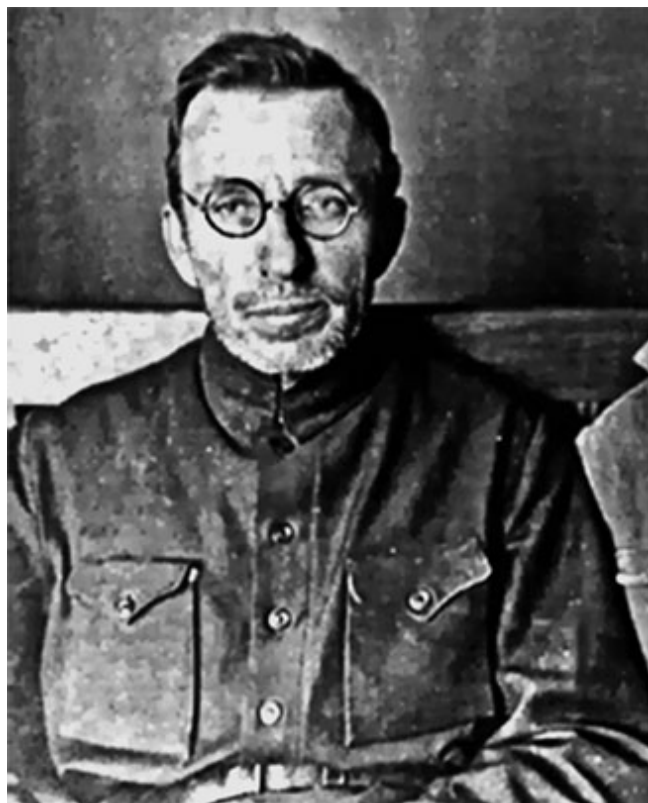
45. А. С. Макаренко. Фото из альбома коммуны им. Ф. Э. Дзержинского 1932 г. с надписью: «Макаренко Антон Семенович. Комментарии излишни».