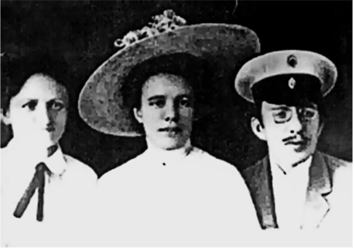
12. А. С. Макаренко на военной службе. Киев. 1916 г.