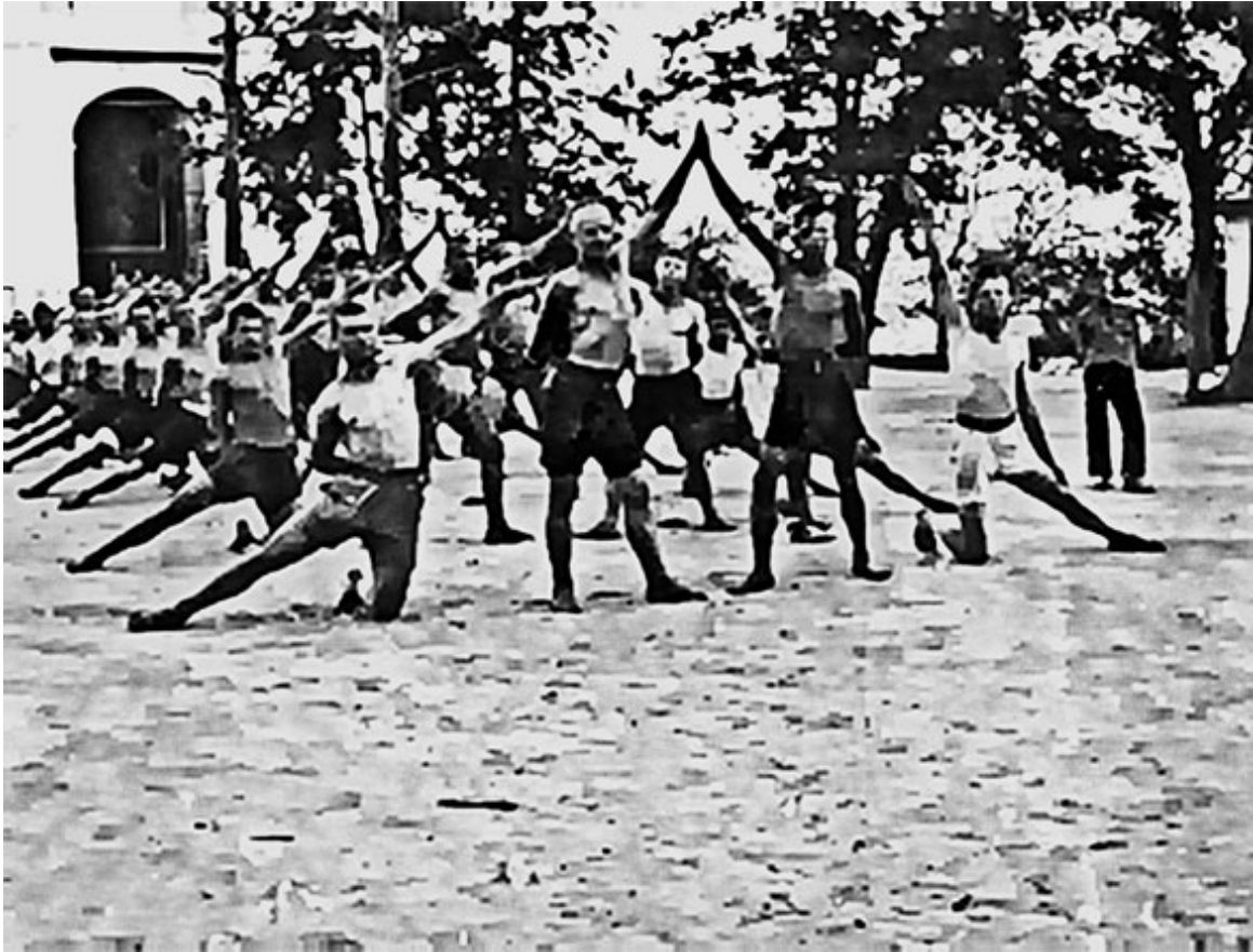
54. Спортивные упражнения колонистов. Куряж.