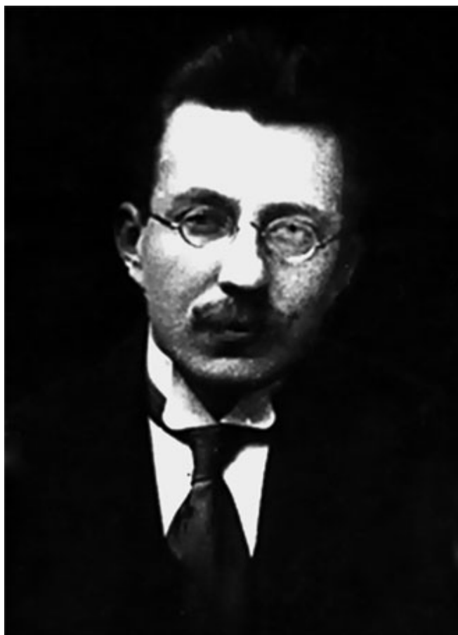
15. А. С. Макаренко – инспектор Крюковского начального железнодорожного училища. 1917–1918 гг.