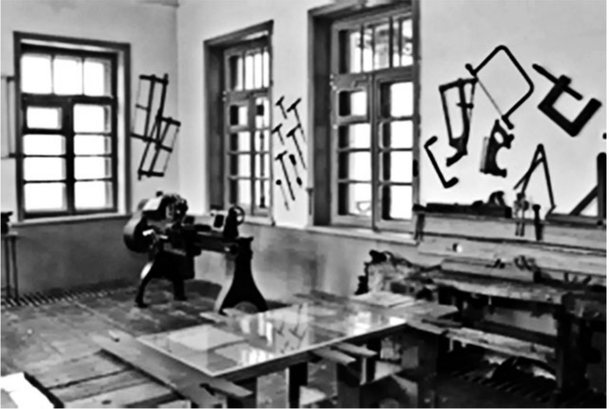
34. Мастерская колонии им. М. Горького.