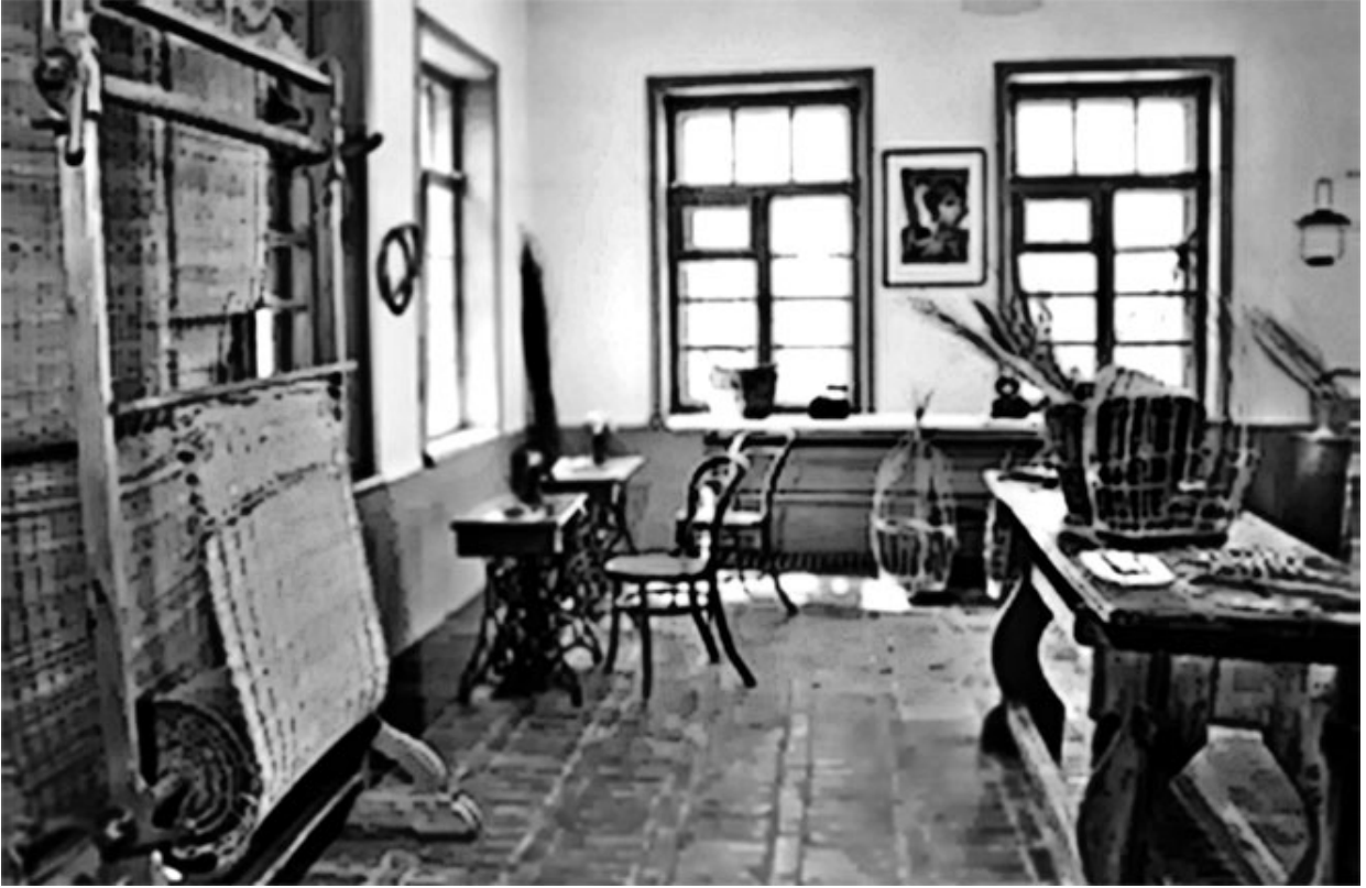
35. Оформление клумбы.