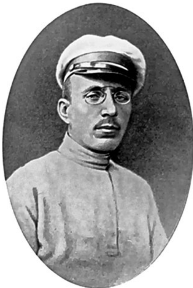
19. А. С. Макаренко. 1925 г.