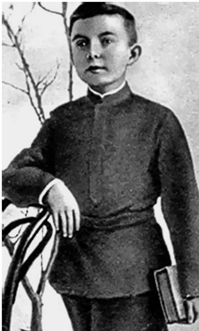
2. Антон Макаренко – школьник. 1901 г.