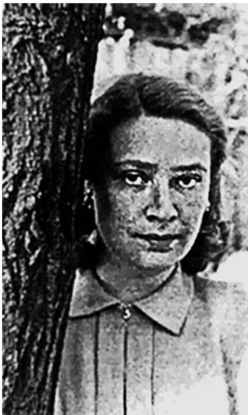
70. О. В. Макаренко. 1950 г.