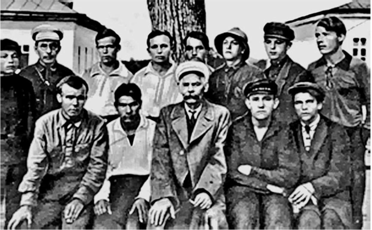
53. Стоит второй слева А. С. Макаренко. В центре сидит А. М. Горький. Июль 1928 г.