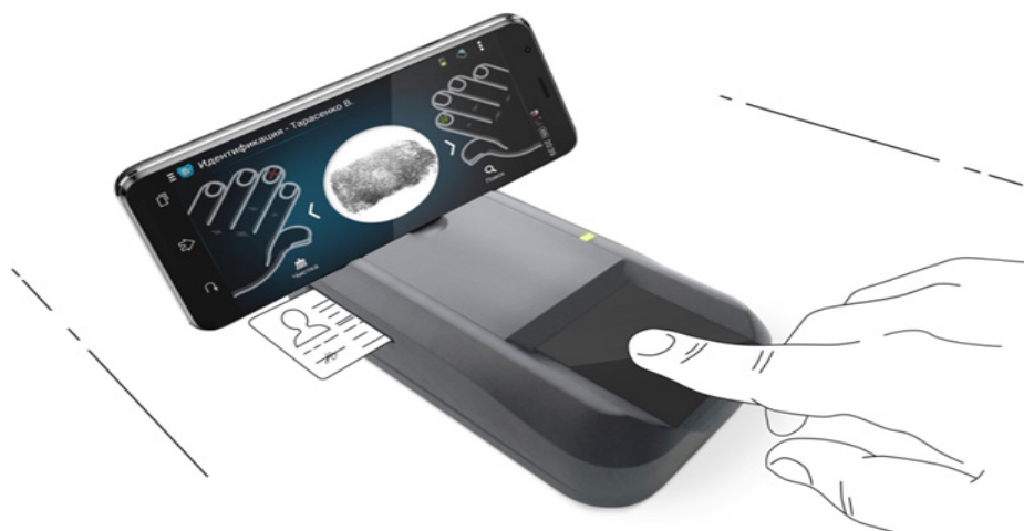
Рис. 1. Мобильный мультибиометрический терминал Паппилон ДиПП-8

по удаленной и локальной мультибиометрическим базам данных, а также позволяет считывать документ, удостоверяющий личность [13].