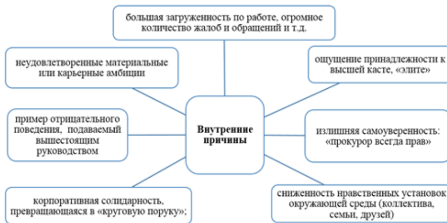
Рис. 2. Внутренние причины моральной деформации прокурорских работников 2

Необходимо выявить опыт нравственного воспитания будущих сотрудников прокуратуры, так как это позволит выстроить обучение таким образом, чтобы оно способствовало формированию тех навыков, которые отсутствуют или присутствуют в зачаточном состоянии. К внутренним причинам моральной деформации сотрудников прокуратуры можно отнести следующие (рис. 2).