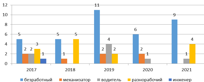
Рис. 3. Уровень занятости осужденных за преступления против половой неприкосновенности несовершеннолетних.

И здесь немаловажно подчеркнуть, что до совершения преступления были безработными 55% преступников.