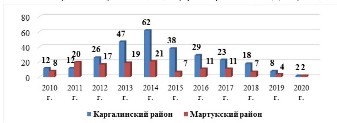
Рис. 3. Соотношение совершенных хулиганств в двух приграничных районах (Каргалинском и Мартукском) за 2010-2020 гг.

Однако в обоих районах из перечисленных одним из доминирующих составов преступлений является хулиганство и занимает второе место после краж. При этом в Каргалинском районе на протяжении последних 11 лет жители подвергаются в 4 раза чаще такому составу правонарушения, как хулиганство (средний показатель за 11 лет: Каргалинский район — 1,6 %, Мартукский район — 0,4 %) (см.: рис. 3).