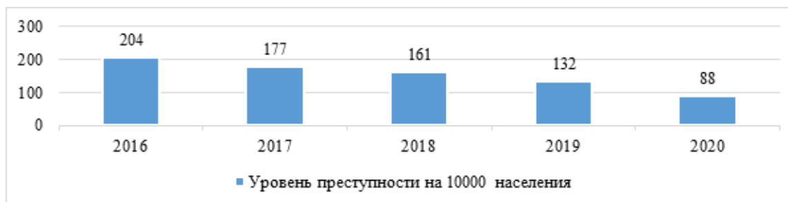
Рис. 1. Уровень преступности на 10000 населения за 2016-2020 годы

Вместе с тем, был определен уровень преступности на 10000 населения с учетом изменения численности населения Республики Казахстан за последние 5 лет (2016-2020 гг.) (см. рис. 1).