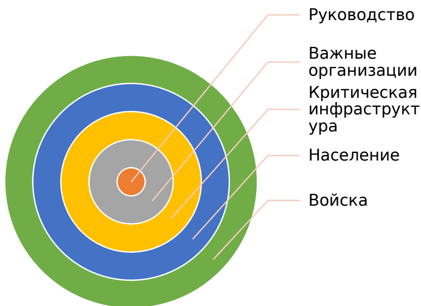
Рис. 1. Стратегические «центры тяжести» противника по Дж. Вардену.

Анализируя врага как систему, он разработал модель ранжирования стратегических «центров тяжести» противника в форме пяти концентрических колец (рис. 1.).