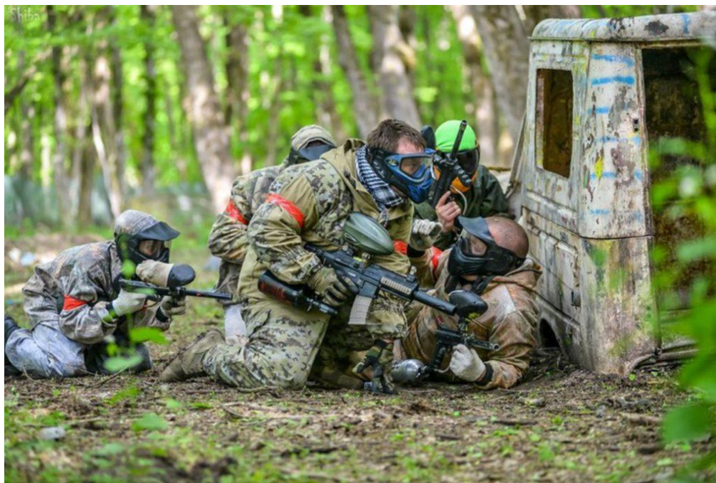
Рисунок 5. Игра в пейнтбол

В настоящее время широкое распространение получили центры обучения, в которых имеется оборудование по типу пейнтбола (рис. 5). Основной целью такого центра является отработка и привитие тактического мышления, умения четко выполнять необходимые действия как индивидуально, так и в составе подразделения.