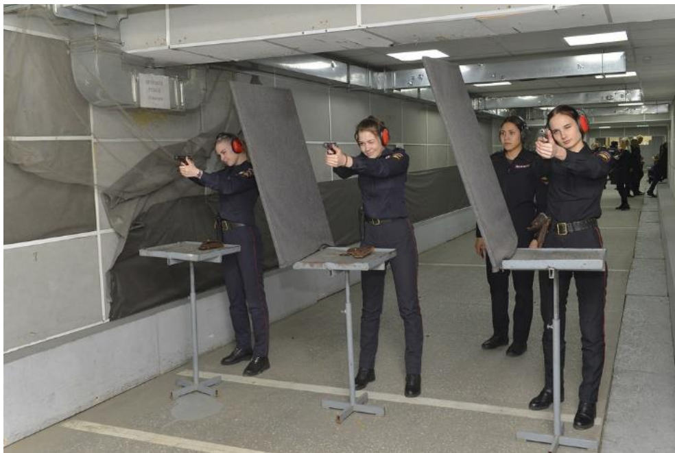
Рисунок 4. Прицельная стрельба

сотрудник должен выполнить свои задачи в полном объеме. Чаще всего контакт происходит в зданиях, сооружениях, на улице, в тех местах, где могут находиться посторонние лица. Для того чтобы не причинить вреда здоровью другим лицам, необходимо вести прицельный огонь. Для этого необходимо использовать методы обучения точной стрельбе при помощи двух рук и с элементами правильного прицеливания, как на рис. 4.