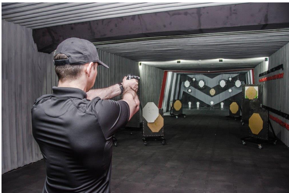
Рисунок 3. Короткие дистанции

Стрельба из различных положений. Как уже говорилось ранее, в боевом контакте возникают различные ситуации, в которых сотрудник должен вести огонь. Также можно привести примеры стрельбы из различных положений, ведь во время боевого контакта необходимо не только пытаться поразить цель, но и укрываться от встречного огня, что принуждает сотрудника к занятию различных положений. В литературе имеется множество методик обучения стрельбе из различных положений.