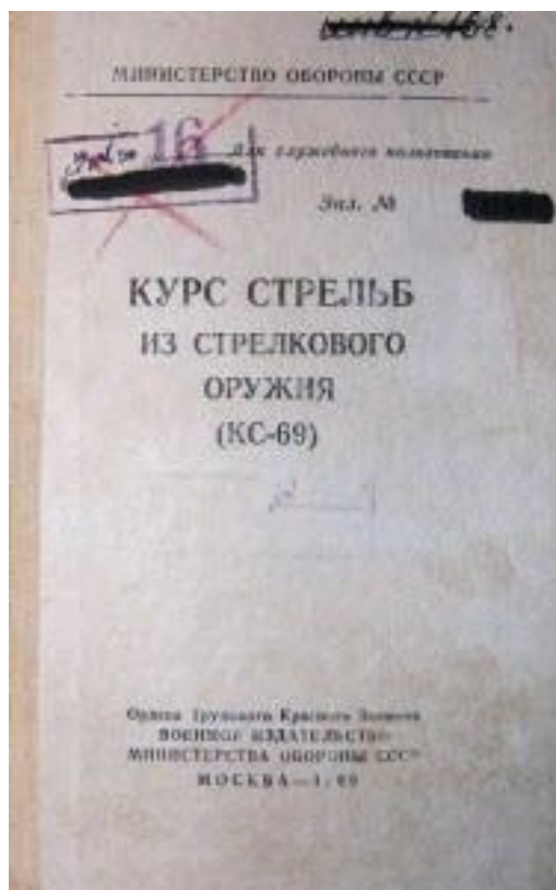
Рисунок 2. Курс стрельб СССР

В то время было больше самостоятельной подготовки стрелков, в связи с отсутствием нужного тренерского штаба, и с большим количеством обучающихся. Статья 53 Курса стрельб 1932 года гласит: «С 400 метров и ближе ружейный огонь является незаменимым и наиболее действительным средством для поражения одиночных, живых целей, особенно появляющихся внезапно, на короткое время, и быстродвигающихся. Поражение таких целей требует от бойца умения вести самостоятельный индивидуальный огонь, руководствуясь собственными боевым и стрелковым глазомером, согласованно с задачей и действиями своего подразделения» (рис. 2).