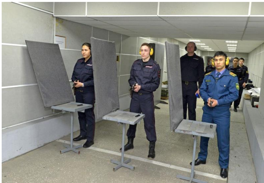
Рисунок 1. Изготовка на огневом рубеже

Основная часть упражнений, заложенных в Наставлении, подразумевает под собой выполнение стрельбы с места и удобного для сотрудника положения для стрельбы, оружие всегда находится напротив мишени, а также всегда однообразно находится в кобуре, кобура расположена на брючном ремне в абсолютной доступности, извлечению оружия из кобуры сотрудником ничего не препятствует (рис. 1). Можно ли сказать о том, что данные условия категорически не схожи с условиями, которые возникают в практической деятельности?